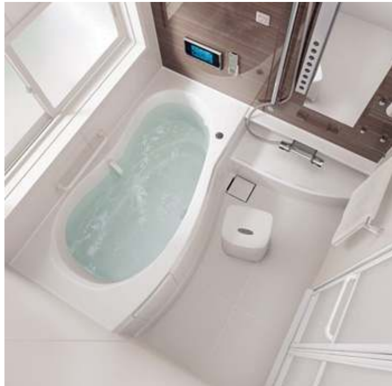
※ユニットバスはイメージです。別紙ご参照ください。