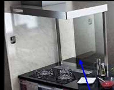
ハイタイプ (ガラス製) H800