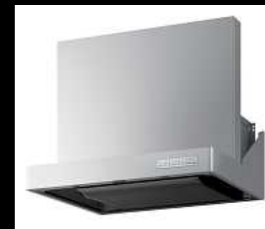
VRAタイプ ステンレス仕上げ LED照明